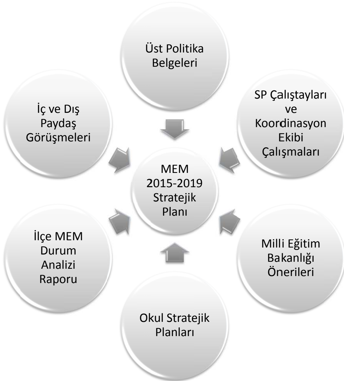
Şekil: Plan Oluşum Şeması